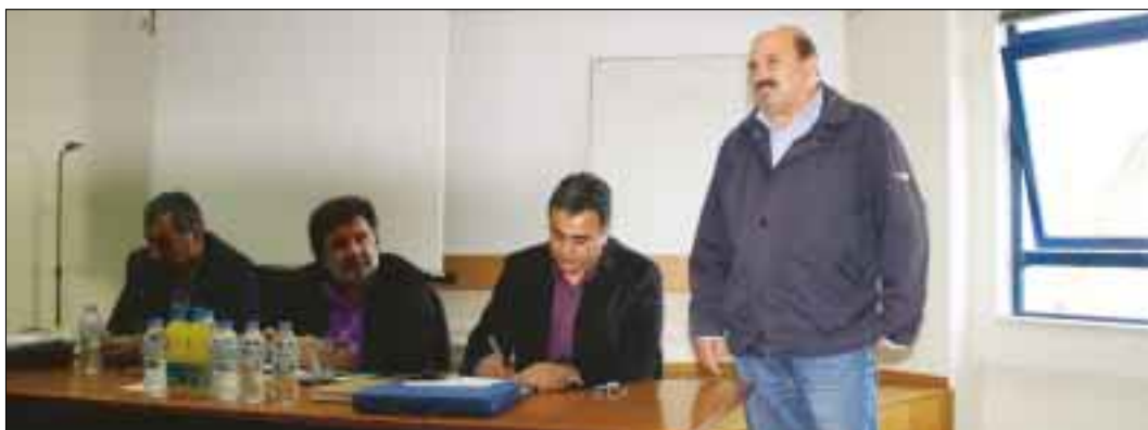
Περιφερειακή σύσκεψη στη Λαμία.

τος, να λάβουν θέση μάχης και να διαδηλώσουν τη θέλησή τους για μια ΑΓΩΝΙΣΤΙΚΗ ΠΟΡΕΙΑ, που θα βάλει τέλος στον κατήφορο που συντελείται εδώ και χρόνια στη ΔΕΗ.