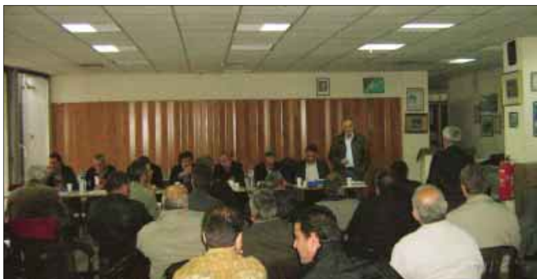
Περιφερειακή σύσκεψη στη Θεσσαλονίκη.

προβλημάτων από τη βάση, από τους εργαζόμενους της πρώτης γραμμής.