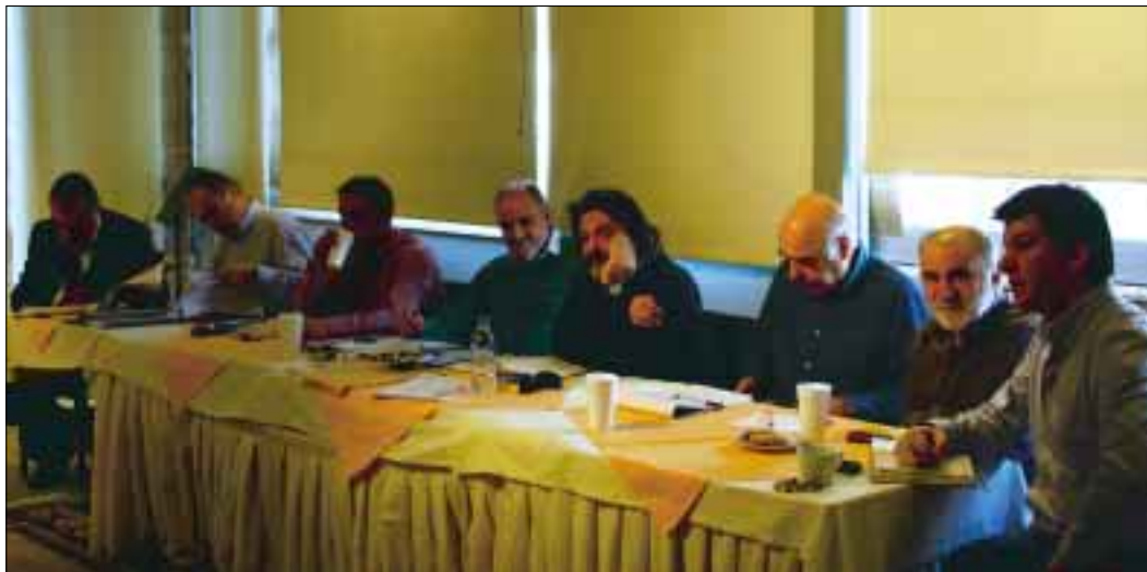
Περιφερειακή σύσκεψη στο Αγρίνιο.

νους της ΔΕΗ, σε γενικό ξεσηκωμό για να υπερασπίσουμε τα κεκτημένα, να υπερασπίσουμε τη δημόσια περιουσία και το κοινωνικό κράτος.