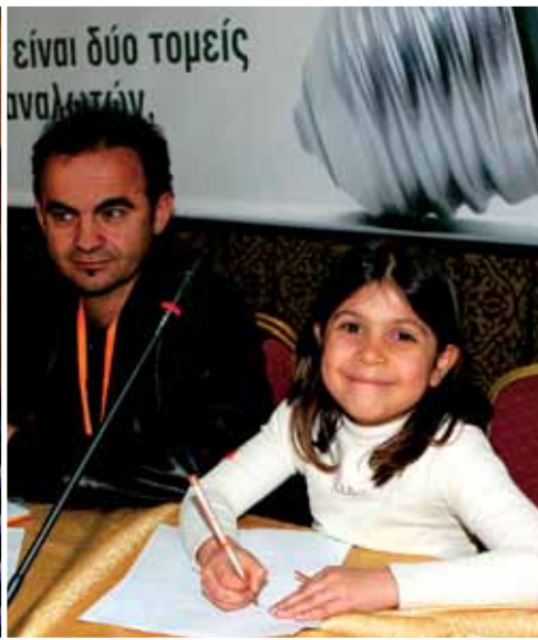
Το Συμβούλιο λάμπριναν με την παρουσία τους παιδιά συναδέλφων.

βρίσκονται σε αντιπαράθεση και αυτό αποδεικνύεται από τις καθημερινές εξελίξεις».