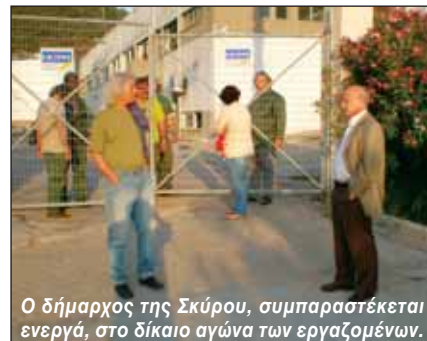
Ο δήμαρχος της Σκύρου, συμπαραστέκεται ενεργά, στο δίκαιο αγώνα των εργαζομένων.

Ειδικότερα για τα νησιά, η ΕΤΕ/ΔΕΗ κατήγγειλε την εγκατάλειψη και την προκλητική αδιαφορία κράτους και Διοίκησης, σε αντίθεση με την αυτοθυσία των εργαζομένων, που καθημερινά δίνουν τον καλύτερο εαυτό τους, έχοντας πλήρη συνείδηση ότι επιτελούν κοινωνικό έργο.