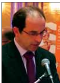
Ο πρόεδρος της Ν.Ε του ΛΑ.Ο.Σ Κοζάνης,

Έκλεισε λέγοντας ότι η ΔΕΗ πρέπει να διατηρήσει τον δημόσιο και κοινωνικό χαρακτήρα της και παράλληλα να αναπτυχθεί, ώστε να καλύψει τις ενεργειακές ανάγκες της χώρας, με νέους όρους, με νέες επενδύσεις, με εκσυγχρονισμό των μονάδων της και επενδύσεις σε ήπιες μορφές ενέργειας.